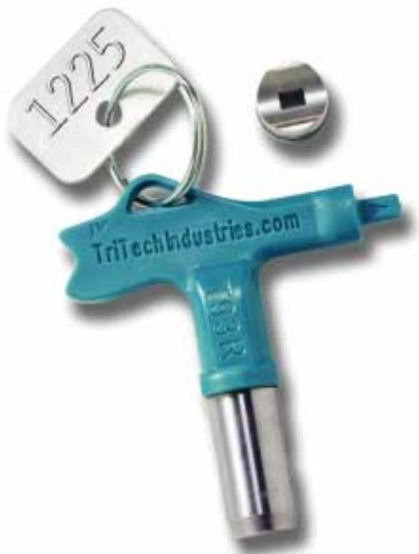
Tabela rozmiarów serii Hi-Production

10 różnych kombinacji szerokości wachlarza natrysku i dużych średnic otworu dysz do prac wymagających wysokiej wydajności. 5000 PSI (345 BAR)